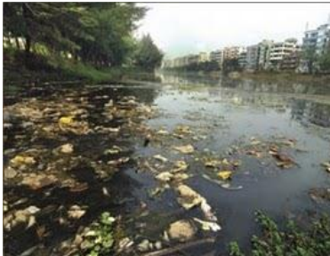
Gambar 2. Sampah di sungai