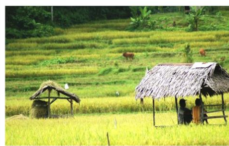
Gambar 2. Sawah