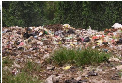
Gambar 3. Sampah di tanah

Gambar 1 menunjukkan asap kendaraan yang hitam pekat. Gambar 2 menunjukkan sampah yang mengotori lingkungan sungai. Gambar 3 menunjukkan tumpukan sampah yang menggunung sehingga merusak tanah. Mengapa hal tersebut dapat terjadi? Benarkan aktivitas manusia dapat merusak lingkungan? Lalu bagaimana cara mengatasi lingkungan yang telah rusak? Temukan pencemaran lingkungan di daerah sekitarmu!