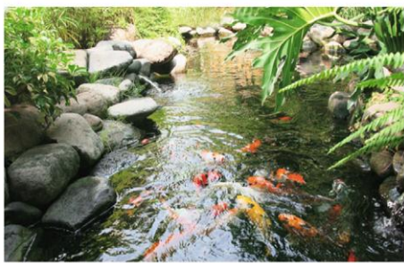
Gambar 1. Kolam

Setiap makhluk hidup membutuhkan lingkungan tertentu sebagai tempat hidupnya. Tempat hidup ikan, burung, serangga, sapi, maupun manusia beserta hewan lainnya tentu berbeda. Perhatikan gambar dibawah ini!