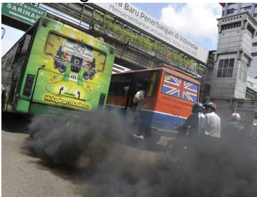
Gambar 1. Asap kendaraan

Pola interaksi antar makhluk hidup maupun kepadatan populasi makhluk hidup dapat mempengaruhi perubahan lingkungan. Perubahan dapat menuju ke arah positif maupun negatif. Semakin padat populasi manusia justru akan mempengaruhi perubahan lingkungan ke arah negatif yang disebut pencemaran lingkungan. Mengapa demikian? Perhatikan gambar berikut.